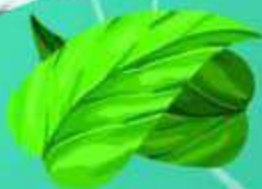
mix de lechuga