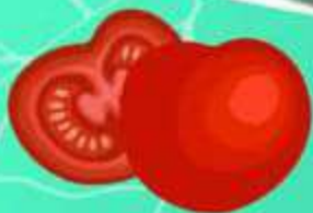
pico de gallo